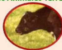
Perineumonía Contagiosa Bovina (14 países)