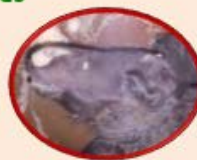
Peste Equina (71 países)