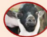
Peste de los Pequeños Rumiantes (53 países)