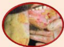
Fiebre Aftosa (67 países)