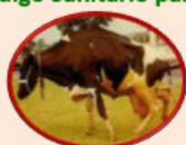
Encefalopatía Espongiforme Bovina (46 países)