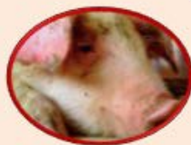
Fiebre Porcina Clásica (30 países)